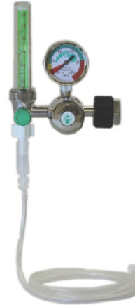
KN-1061-2B 酸素添加ユニット