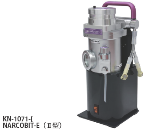
KN-1071-I NARCOBIT-E (Ⅱ型)

添加する酸素量に応じて、酸素添加ユニット流量(L/分)(1L、2L、10L)の選択が必要です。