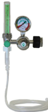
KN-1061 酸素添加ユニット