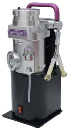
KN-1071 NARCOBIT-E (Ⅱ型)

添加する酸素量に応じて、酸素添加ユニット流量(L/分)(1L、2L、10L)の選択が必要です。