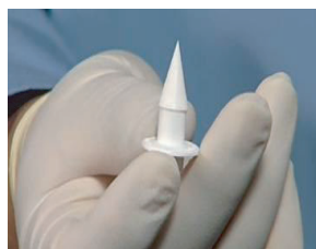
ディスポーザブルバルブ