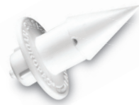
Hydropac® 滅菌水給水パウチ