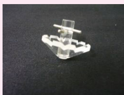
⑥ 固形物分離用コマ (アクリル製)