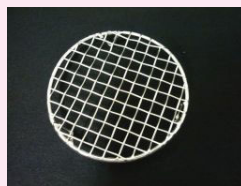
④ 脚付スノコ・網目大 (SUS製)