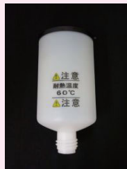
② ケージ本体部 (PE製)