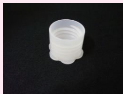
⑦ 尿受け兼用キャップ (PP製)