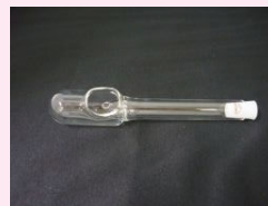
⑨ ガラス製給水器 ⑩ ゴム栓 (給水器用)