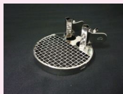
③ クリップ付蓋 (SUS製)