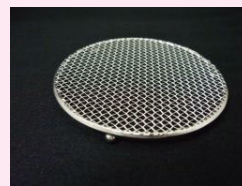
⑤ 固形物受けスノコ・網目小 (SUS製)