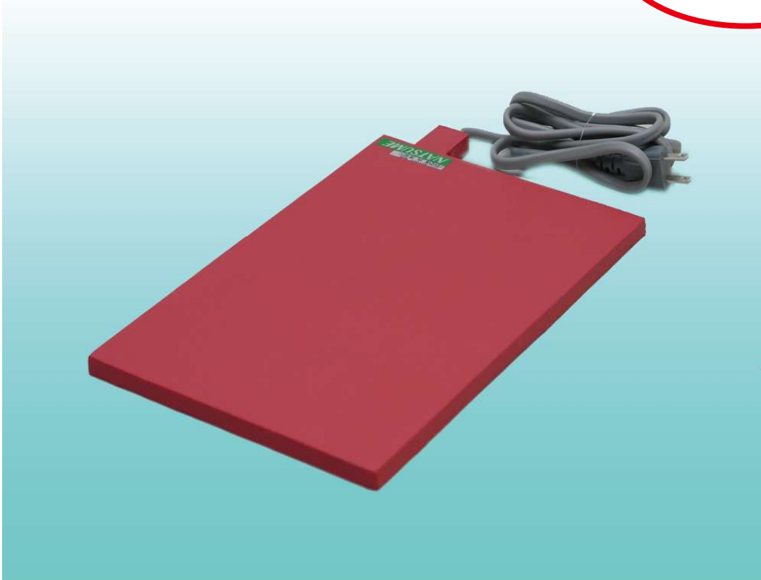
(画像: Ⅲ型 W200×L300×T10mm)