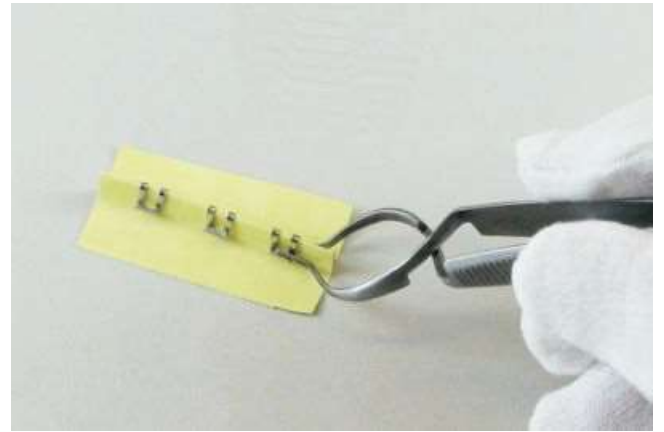
② リムーバーの先端部をクリップ左右凹部に、はめ込みます。