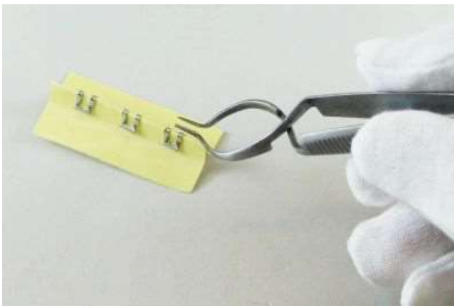
① 縫合クリップの凸部にリムーバー先端部を添わせて下にさげます。