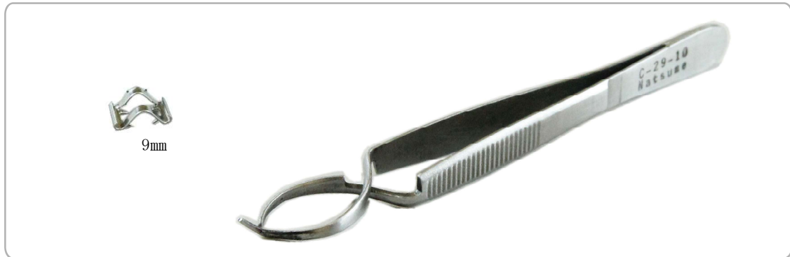
使用前の縫合クリップ(鋏)