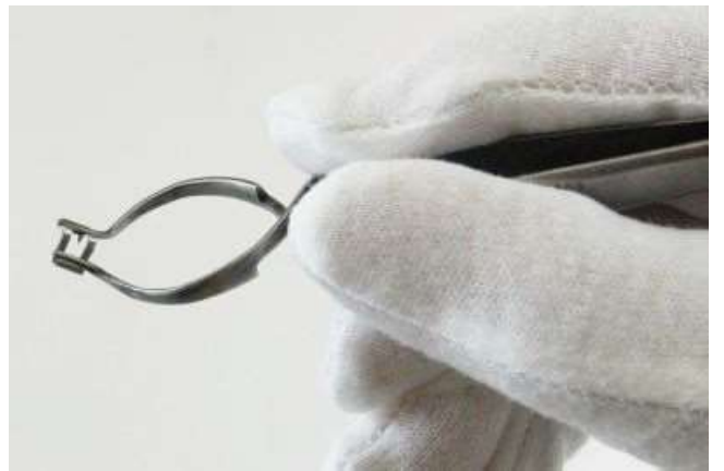
④ リムーバーを持ち上げれば、クリップは除去されます。