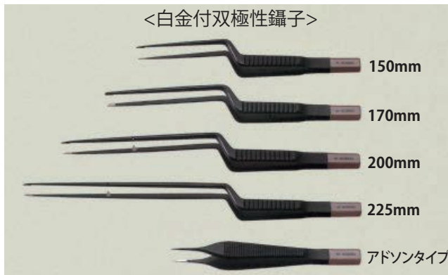
<白金付双極性鑷子>

白金付双極性鑷子5種は、先端に通電性にすぐれた白金性の先端チップを採用しています。