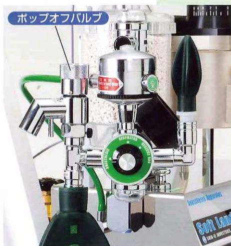
ポップオフバルブ