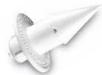
Hydropac® 滅菌水給水パウチ