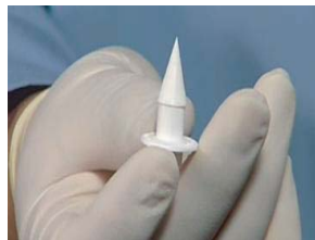
ディスポーザブルバルブ