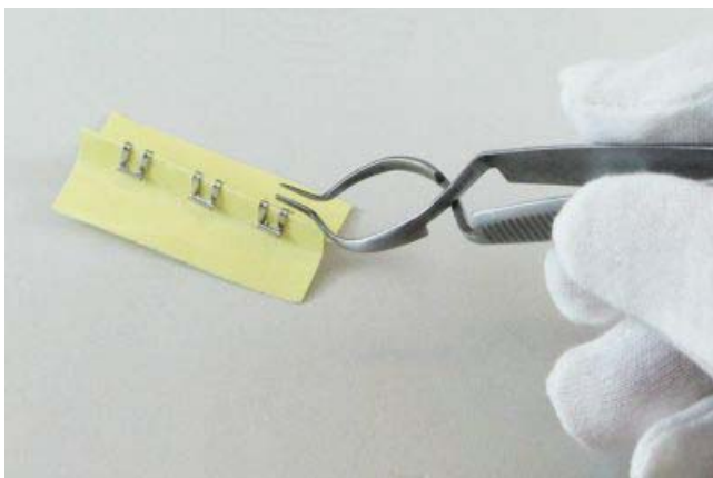
① 縫合クリップの凸部にリムーバー先端部を添わせて下にさげます。