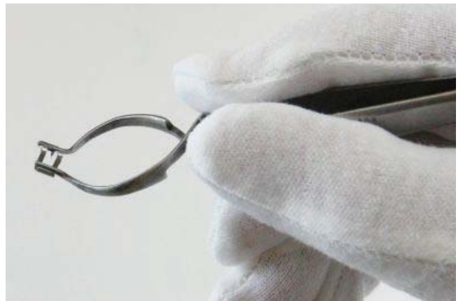
④ リムーバーを持ち上げれば、クリップは除去されます。