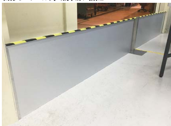
画像 5：幅広タイプ（中間柱）