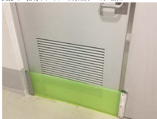
画像 6：マグネット式（ステンレス&樹脂）

※ 施設の設備や用途、使用動物に合わせ、様々なサイズで設計・製作を承ります、ご相談ください。