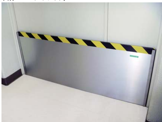
画像 3：レール式（親子扉に設置）