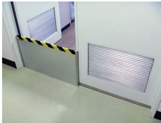
画像 2：両面扉（片側のみ）に設置