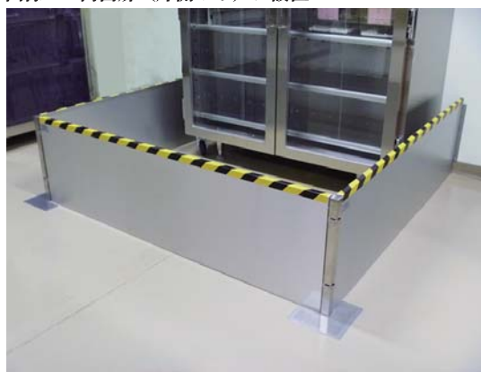
画像 4：仕切りタイプ（実験室内の一角に設置）