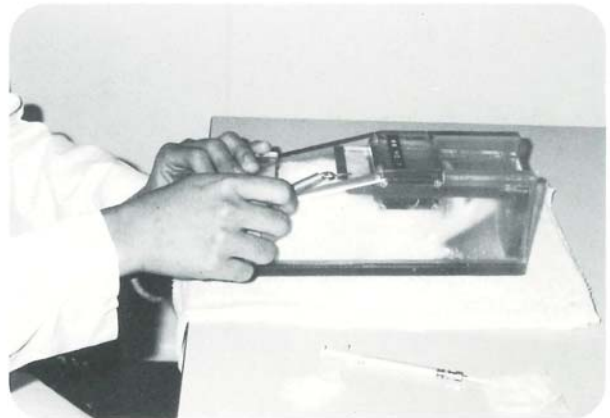
④動物の固定 (固定板の穴に鼻面を出すので、体長に合わせてスプリングで無理なく固定できます。)