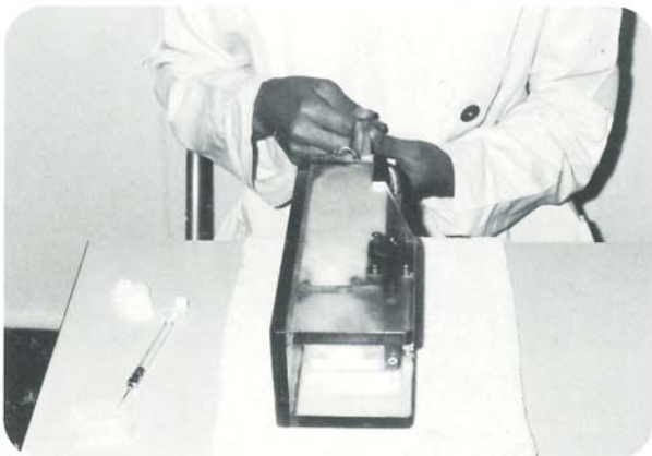
⑤横倒しにして静脈部を上に行っているところ