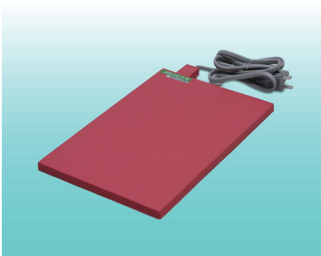
(画像: III型 W200×L300×T10mm)

パネル全面をむらなく暖める面発熱方式の採用により、高い安全性を実現しました。 水にも強い驚異の耐久性を持つ保温用マットです。 新生仔の保温、手術時及び術後の保温に適しております。