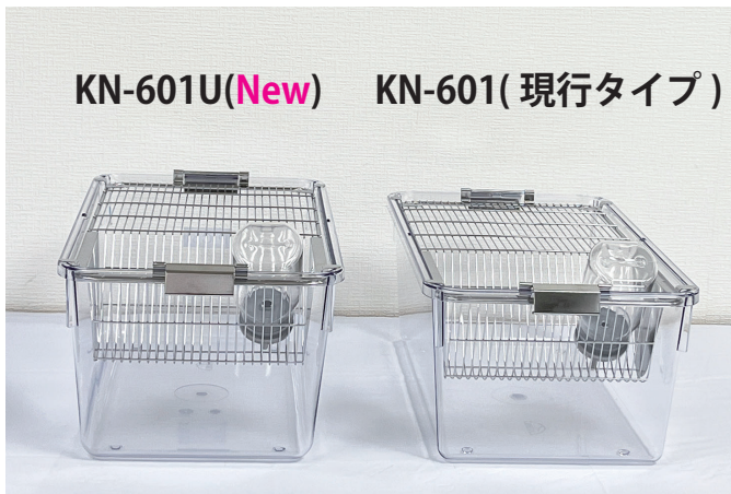
KN-601U(New) KN-601( 現行タイプ )

Universal な視点からガイドラインに準拠し、今までの使用感を損なわない Usability を備えるため、当社のマウスケージは KN-600 から KN-600U へ進化しました。単に国際的なガイドラインに寸法上合致するだけでなく、洗浄・積み重ね等、普段の使いやすさも同時に追求し、ラットケージも KN-601U に生まれ変わります。今までのケージトップと互換性があるだけでなく、インナーケージ等関連製品もあわせてグレード UP します。