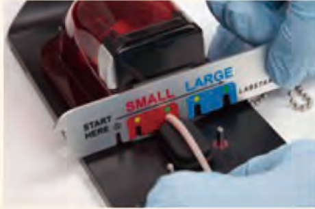
②テイルゲージで使用する針を選びます。