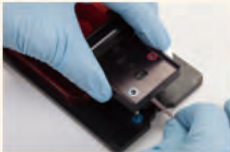
⑤インク・スライドを差し込んだテイルカバーを装着します。