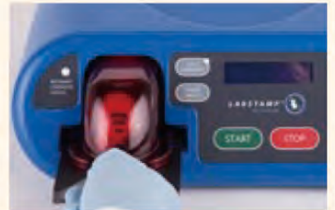
⑥保定器を本体にセットし、印字するアルファベットや数字を入力します。「START」を押すとライトが赤く点滅し、ライトが緑に変わったら印字終了です。