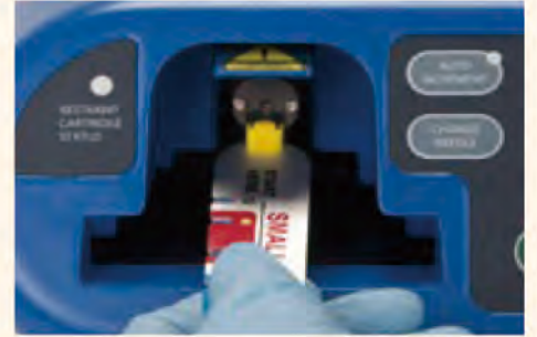
③針を本体にセットします。