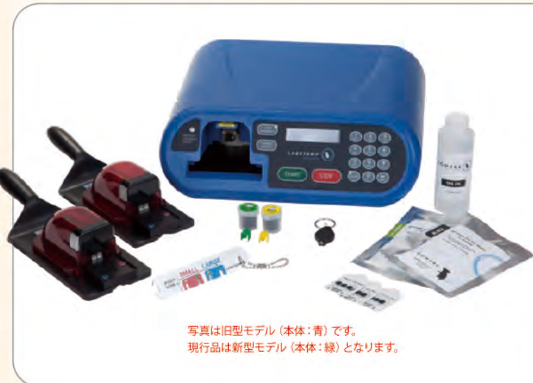
写真は旧型モデル (本体:青) です。 現行品は新型モデル (本体:緑) となります。